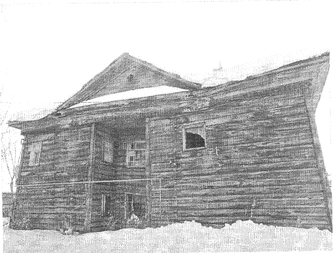
Фото 3 от 03.03.2025. Северо-восточный фасад.