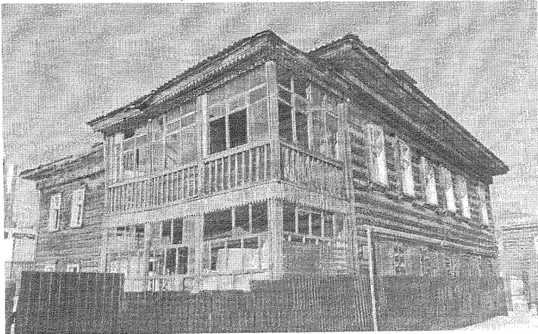
Фото 1 от 03.03.2025. Угол юго-восточного и юго-западного фасадов.

Алтайский край, г. Барнаул, ул. Интернациональная, 96 (наименование и адрес объекта культурного наследия)